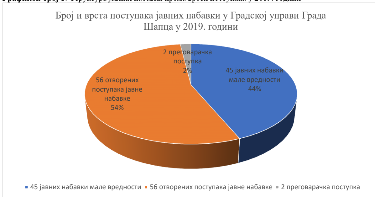
Графикон број 1: Структура јавних набавки према врсти поступака у 2019. години

Ревизијом је обухваћено укупно једанаест поступака јавних набавки, од чега је десет спроведено у отвореном поступку и једна у поступку јавне набавке мале вредности. Уговорена вредност у узоркованим поступцима јавних набавки износи 821.515.409 динара са ПДВ-ом, што је 62% укупно уговорене вредности у спроведеним поступцима.