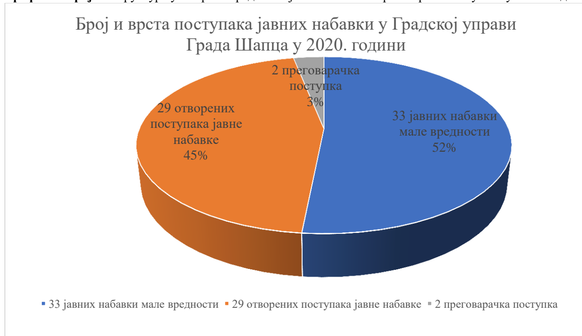
Графикон број 3: Структура уговорене вредности јавних набавки према врсти поступака у 2020. години

Ревизијом је обухваћено укупно десет поступака јавних набавки, од чега је седам спроведено у отвореном поступку, а три у поступку јавне набавке мале вредности. Уговорена вредност у узоркованим поступцима јавних набавки износи 664.418.159 динара са ПДВ-ом, што је 65% укупно уговорене вредности у спроведеним поступцима.